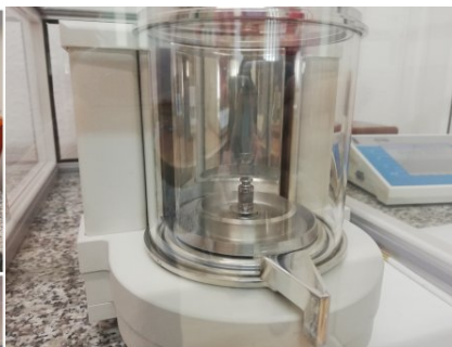
Stanowisko do pomiarów masy_1